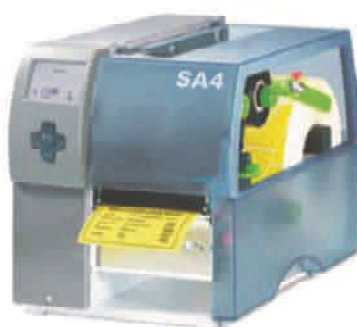
SA4 200/300/600 Dpi