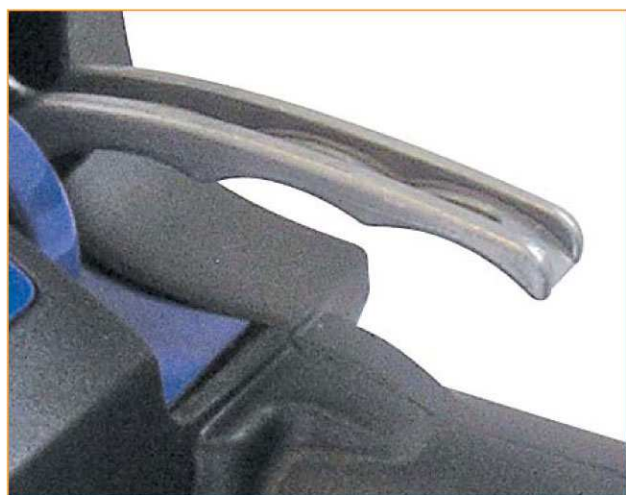
Impugnatura ergonomica - Nuove leve per azionamento saldatura e apertura macchina